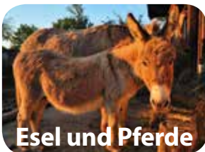
Esel und Pferde