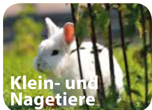
Klein- und Nagetiere